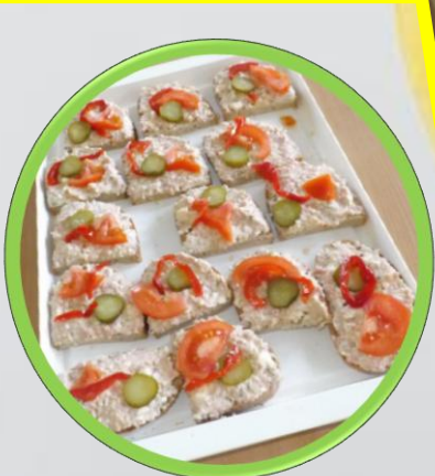
Chutný salámový šalát si pripravili naše „kuchárky a kuchári“.