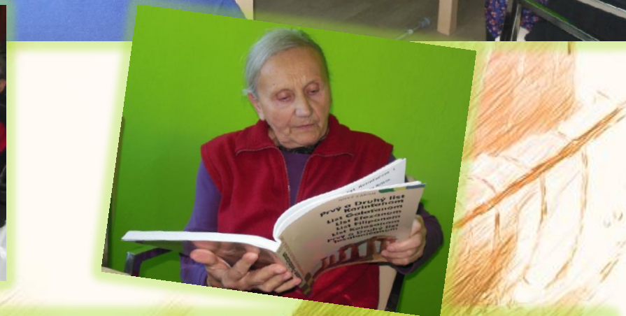
Muži aj ženy si radi posedia pri spoločných rozhovoroch na rôzne témy, pri čítaní kníh, novín,...